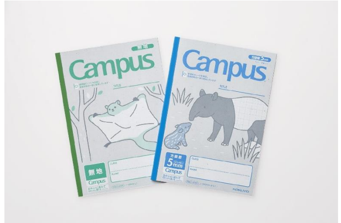
キャンパスノート<つなげるーぱ!>