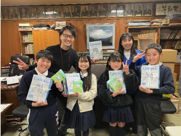
参加校へのノート寄贈

回収したノートをご送付いただいた学校へは、「つなげるーぱ！」プログラムにて回収した使用済みのノートを新しいノートの表紙に再利用した「キャンパスノート<つなげるーぱ!>」のサンプル2冊と、参加児童分の参加賞シールをお送りします。リサイクルの結果が目に見える形になることで、今後の行動を考えるきっかけになることを願っています。