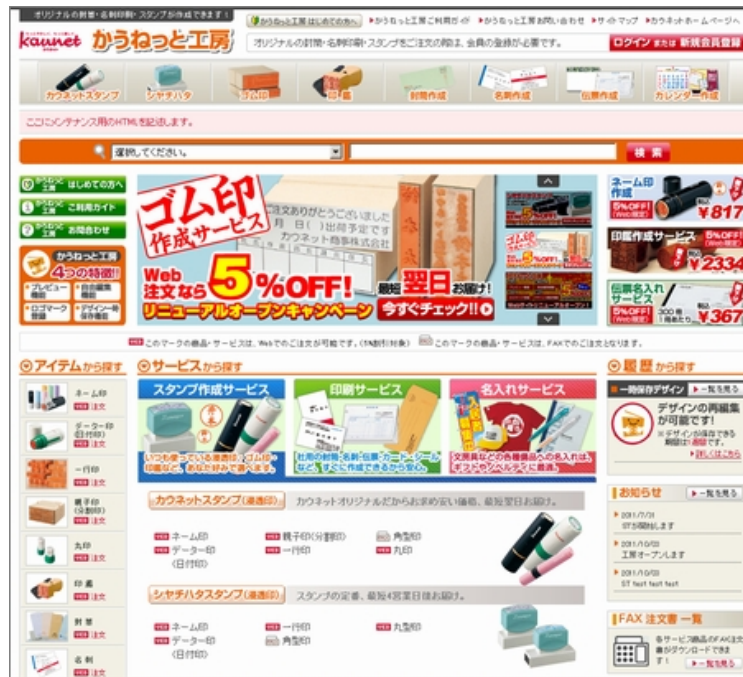
「かうねっと工房」のトップ画面

なお、今回のリニューアルを記念し、Webでの注文に限り5%を値引きするキャンペーンを10月24日から来年3月31日までの期間限定で実施します。