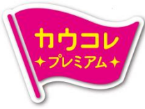
「カウコレ」プレミアム ロゴマーク