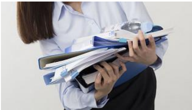
『ミーティングバッグ(フタ付)』 商品前使用イメージ