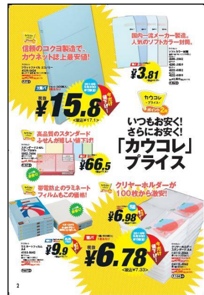
左:カウネットカタログ2016年秋冬号(第32号) 表紙 中:9月実施予定の「カウコレ」プレミアム期間限定キャンペーンページ 右:「カウコレ」プライス特集ページ