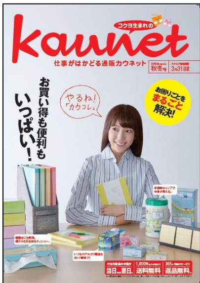
カウネットカタログ2016年秋冬号