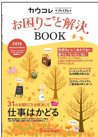
お困りごと解決BOOK表紙