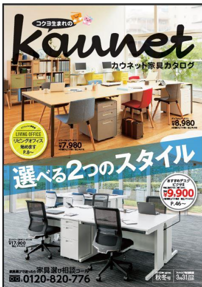
カウネット家具カタログ2016年秋冬号