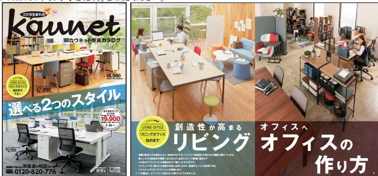
左:カウネット家具カタログ2016年秋冬号 表紙

当カタログ発売と同時に、「カウネットカタログ2016年秋冬号」、「カウコレ」プレミアムだけを掲載し、お客様のお困りごと解決に徹底的にこだわった「お困りごと解決BOOK2016年秋冬号」も発売します。両カタログについてはプレスリリース「カウネットカタログ2016年秋冬号(第32号)を発売」、「お困りごと解決BOOK2016年秋冬号を発売」をご覧ください。