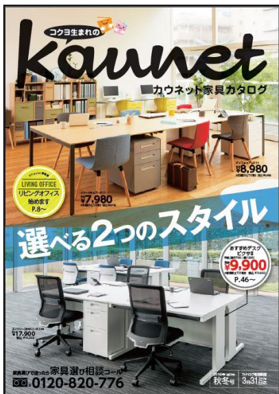
カウネット家具カタログ2016年秋冬号