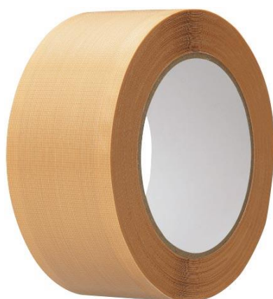
『ラクにはがせる布テープ』 商品写真