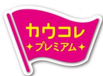
「カウコレ」プレミアム ロゴマーク