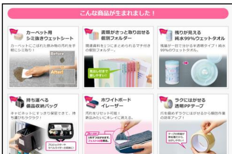
「カウネットモニカ」に投稿された声を参考に生まれた商品

カウネットモニカURL: https://www.kaunetmonika.com/