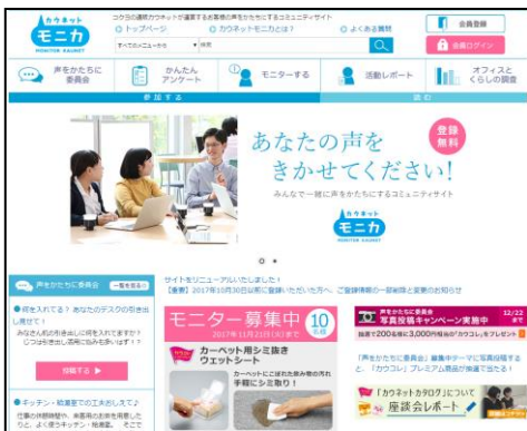
「カウネットモニカ」トップ画面

また12月22日(金)まで「声をかたちに委員会」に写真投稿した会員の中から抽選で200名に3,000円相当の「カウコレプレミアム」商品をプレゼントするキャンペーンを実施しています。