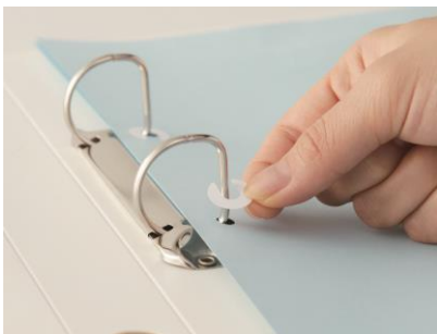
書類をファイリングしたまま補強できる

(※)カウネットモニカとは株式会社カウネットが運営する顧客の声を聞くためのモニターサイトです。