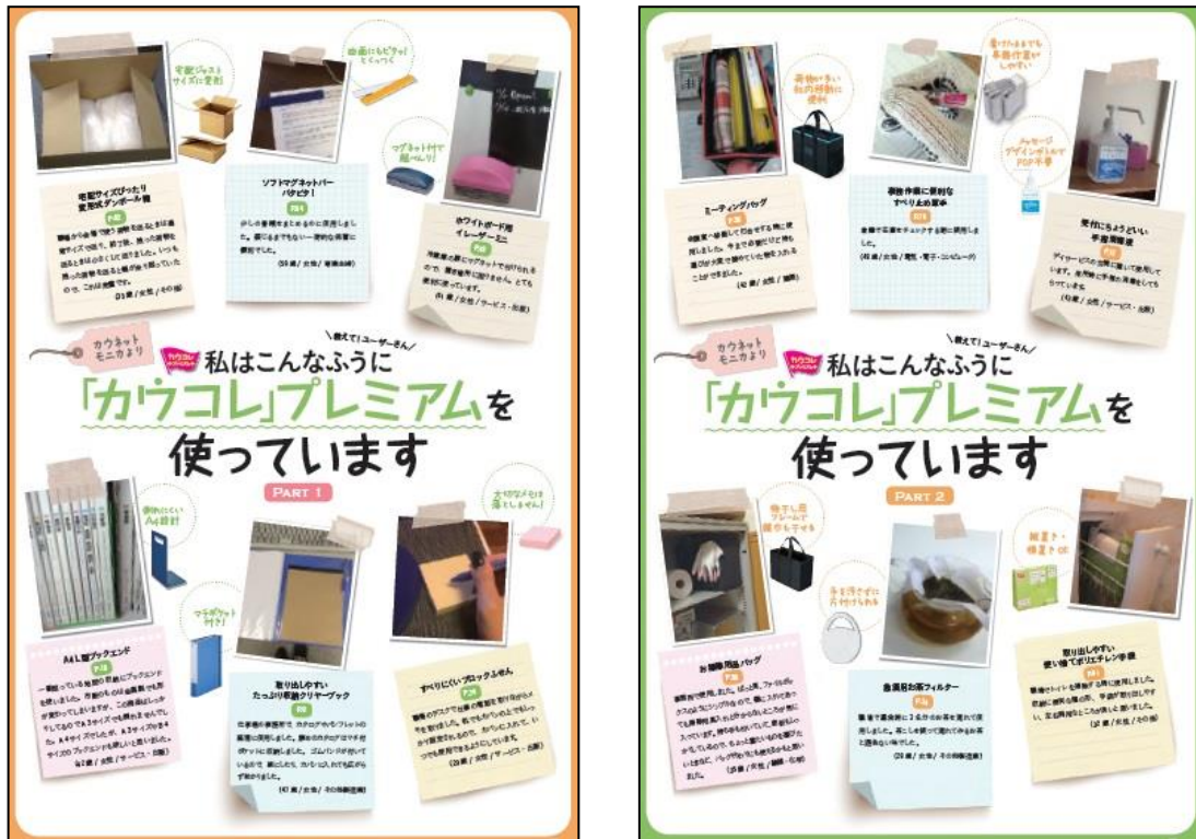
「私はこんなふうに「カウコレ」プレミアムを使っていますページ