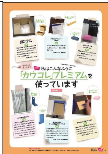
お困りごと解決BOOK表紙(左) ページ例(中、右)