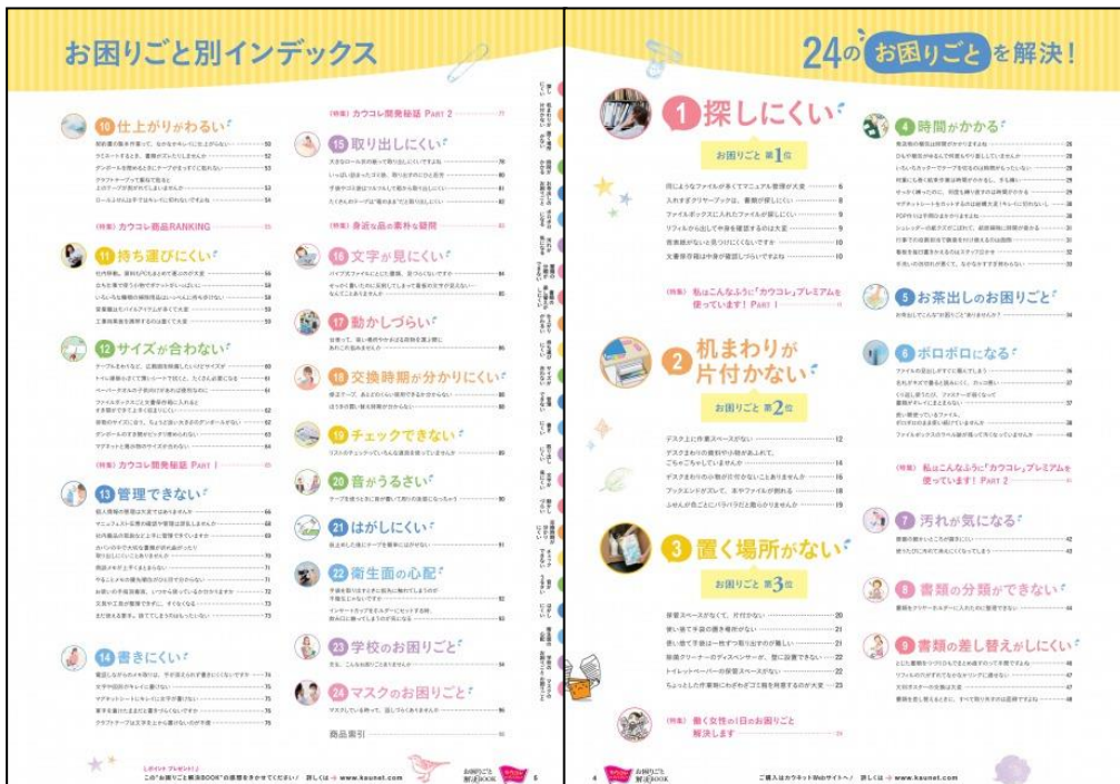
「お困りごと別インデックスページ」

お客様が感じるお困りごと別に商品のカテゴリをインデックス(目次)ページ。お客様が知らない新たな商品を見つけるきっかけにもなります。