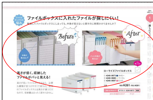
商品ごとに紹介している「Before/After事例」