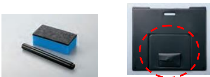
左: 付属品のホワイトボードマーカーとイレーザー 右: 赤丸部分がポケット