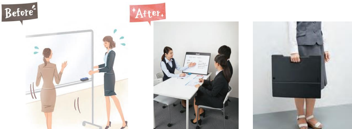
左: 大きいホワイトボードは持ち運ぶのが大変 中、右: 簡単に持ち運べてすぐに設置できる