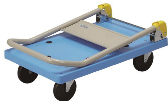
折りたたみ時のケガ防止カバー付