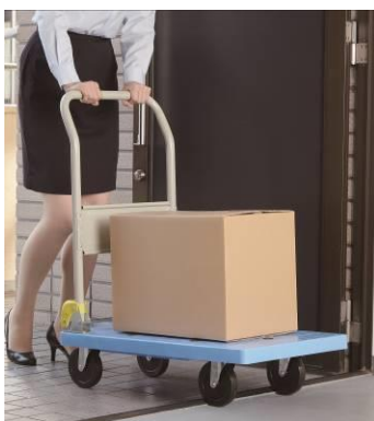
段差が乗り越えやすい

また後輪もキャスターが自在に動くのでエレベーター内などの狭い場所でも横移動や方向の切り返しもしやすいです。