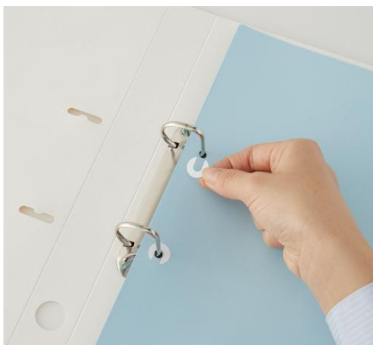
商品使用イメージ