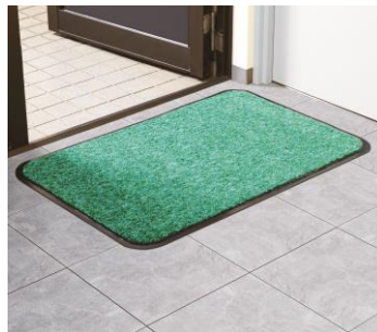
角が丸くカットされているのでめくれにくい めくれにくいので玄関もスッキリ