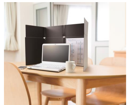
家庭などオフィス以外でも使える