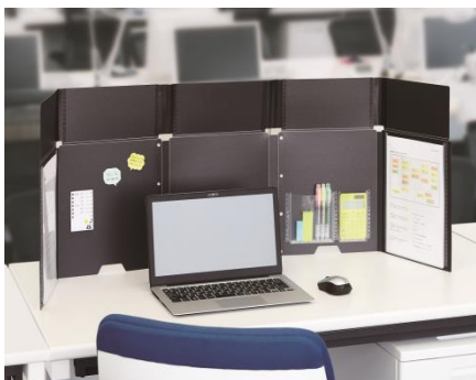
デスク周りの視界を遮り仕事に集中できる

(※)カウネットモニカとは株式会社カウネットが運営する顧客の声を聞くためのモニターサイトです。 カウネットモニカ https://www.kaunetmonika.com/