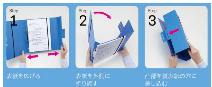
表紙を広げて簡単組み立て