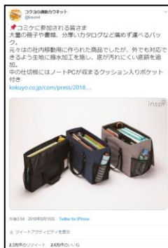
カウネット公式アカウントにて コミケ前にミーティングバッグを紹介。 2万以上リツイートのバズに

今回のクラウドファンディングサイト「Makuake」での反響を見て、カウネットWebサイトでの販売も計画しております。